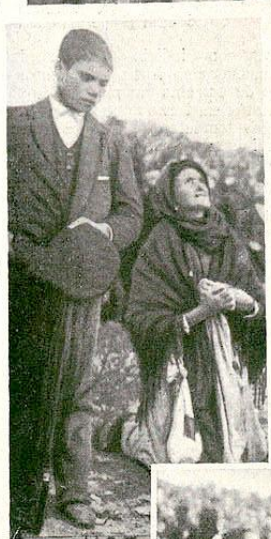
Varios aspectos do povo ajoelhado e orando no momento de descobrir o sol e de se dar o fenomeno que tanto impressionou a multião.

no vagalhão colossal d'aqule povo que ali se juntou a 13 de outubro. O teu racionalismo soureu um formidavel embate e quer.s estabelecer uma opinião segura socorrendo-te de depoimentos inspreitos como o meu, pois que estive lá apenas no desempenho de uma missão bem difficil, tal a de relatar imparcialmente para um grande diario, O Seculo , os factos que diante de mim se desenrolassem e tudo quanto de curioso e de elucidativo a eles se prendesse. Não ficará por satisfazer o teu desejo, mas decerto que os nossos olhos e os nossos ouvidos não viram nem ouviram coisas diversas, e que raros foram os que ficaram insensíveis á grandeza de semelhante espectáculo, unico entre nós e de todo o ponto digno de meditação e de estudo ..